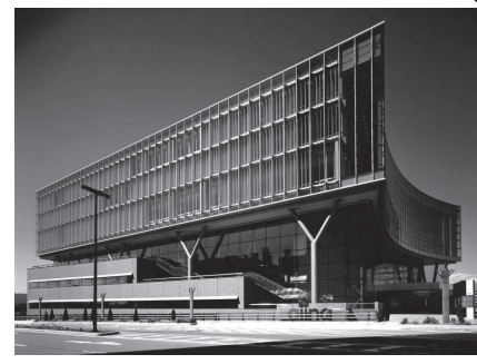
いわて県民情報交流センター (アイーナ)